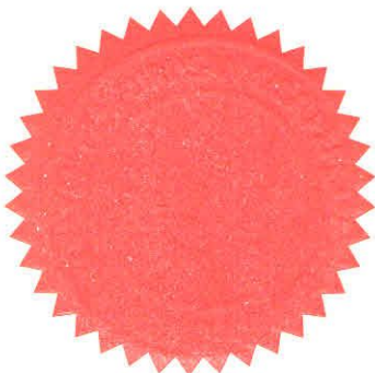
(SULIMAN BIN ABD RAHMAN)

Kelulusan ini adalah tertakluk kepada terma dan syarat-syarat seperti di dalam Seksyen 19(2) dan Seksyen 19(3) Akta 672.